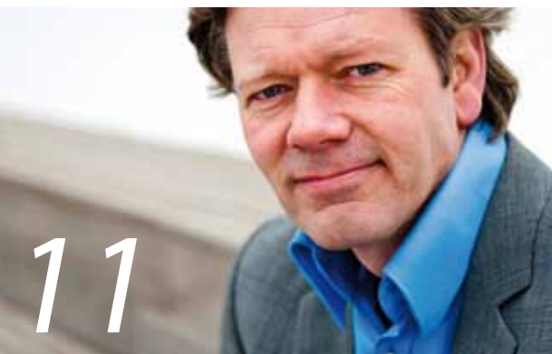
foto verslag ACTIE

"We zijn zo gezegend als christen en het is een rijkdom te mogen uitdelen"