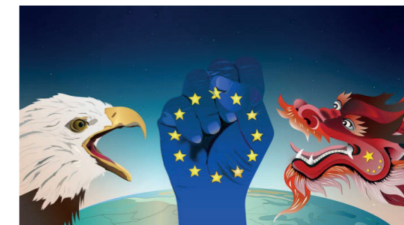
FINANCIAL TIMES - 07/10/19

Tot slot, laten we niet vergeten dat landen hun eigen belang dienen. Daar is niks mis mee en zelfs wenselijk mits dat binnen de regels gebeurt, maar laten we ook met z'n allen niet vergeten dat een sterke EU een gezamenlijk eigen belang is.